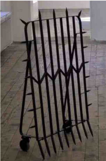
Personal Shield / Ecran de protection personnel – bouclier personnel , Lada Nakonechna Objet en métal Courtoisie de l'artiste. 2011

Personal Shield est un objet dont le modèle a retenu l'attention de l'artiste durant son séjour en Suisse. C'est une petite palissade élevée entre les immeubles dans le but d'empêcher l'accès de l'un à l'autre. Celle-ci a été transformée en un objet mobile pour un usage personnel, une protection individuelle qui permet d'établir des limites entre son utilisateur ou son utilisatrice et son environnement. Cette pièce a été réalisée pour l'exposition de l'artiste en Suisse, construite, relativement bon marché, en Ukraine et transportée par l'artiste à travers les frontières de l'Espace Schengen en tant que bagage à main. Dans l'exposition au Centre d'art contemporain, elle sera accessible aux visiteurs qui pourront l'utiliser.