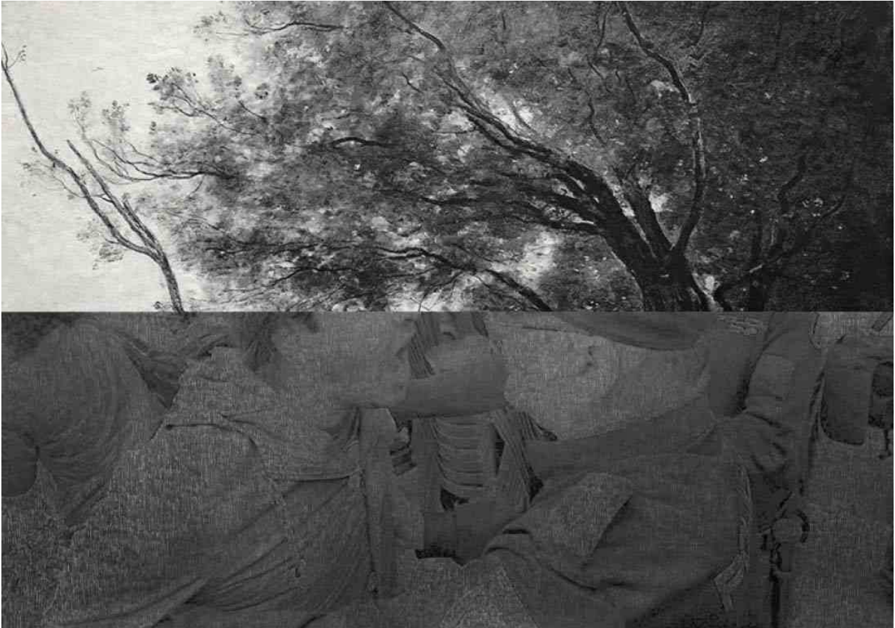
Constructing the new landscape / Construire un nouveau paysage , Lada Nakonechna

Dessin au crayon graphite sur impression jet d'encre + vidéo 5 min.